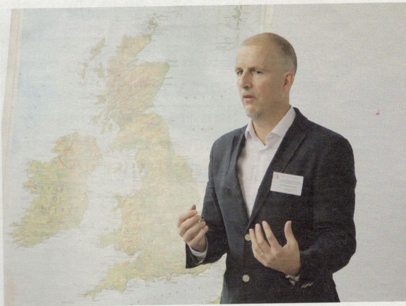
▲ V rámci vyučovania o slovenských reáliách často porovnáva našu krajinu s Britániou.

V roku 1991 ma pozval spolužiak z univerzity, tiež Brit, ktorý študoval ruštinu, na svoju svadbu do Moskvy. Silno to na